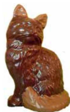
CHAT ASSIS 22,5 cm