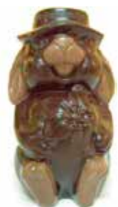
JEANNOT LAPIN 17 cm