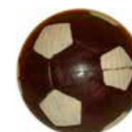
BALLON 22 cm