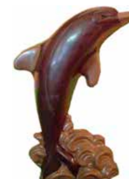
DAUPHIN 27,2 cm