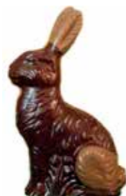
LAPIN ASSIS 17 cm