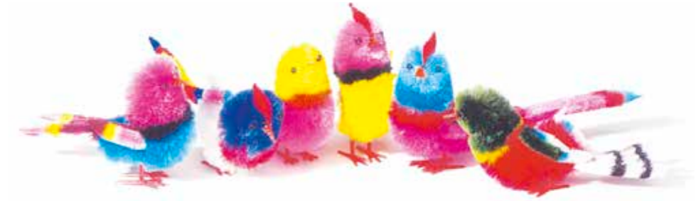
434460 OISEAUX DE PARADIS 80 x 40 mm Boîte de 24