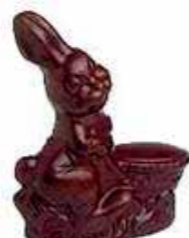
LAPIN brouette 14 cm