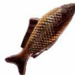
POISSON 18 - 24 cm