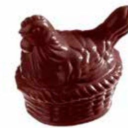
POULE PANIER 14 cm