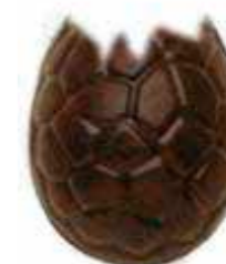
ŒUF OUVERT 13 cm