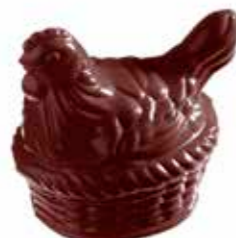
POULE PANIER 14 cm