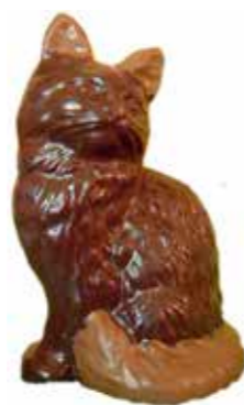
CHAT ASSIS 22,5 cm