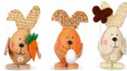
684384 LES ŒUFS NATURE DÉCO 65 mm Boîte de 24