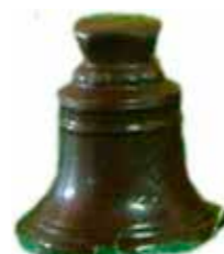
CLOCHE 7,5 - 10 - 19 cm