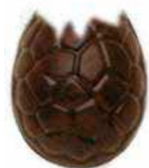
ŒUF OUVERT 13 cm