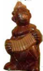
CLOWN 11 cm