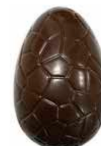
ŒUF 9 - 12 - 13,5 16,5 - 20 cm