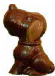
CHIEN 10 cm