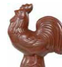
COQ 20 cm