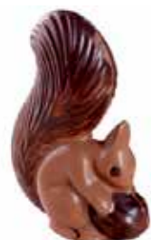
ÉCUREUIL 14,5 cm