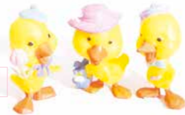
433495 POUSSINS CHANTEURS 30 mm Boîte de 48