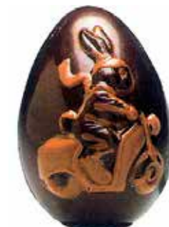
ŒUF LAPIN SCOOTER 22 cm