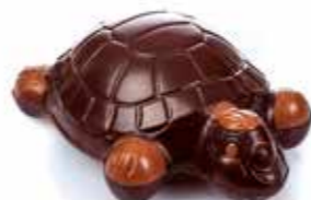
TORTUE 11,5 cm