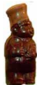
PÂTISSIER 10,5 cm