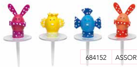
684152 ASSORTIMENT À POIS 30 mm Boîte de 48