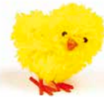
434399 MINI POUSSIN JAUNE 30 mm Boîte de 60