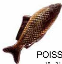
POISSON 18 - 24 cm