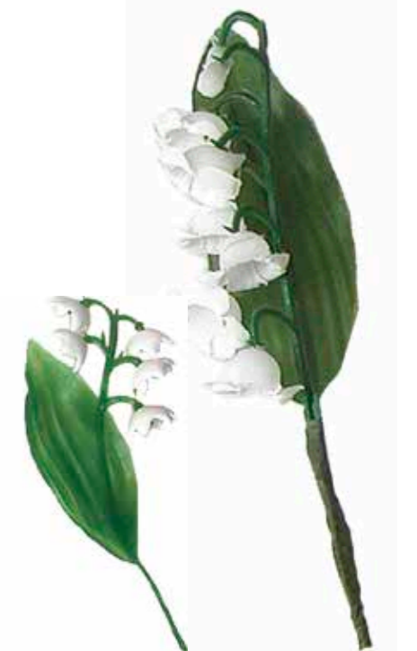
865691 BRIN DE MUGUET PLASTIQUE 90 cm Boîte de 144