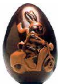
ŒUF LAPIN SCOOTER 22 cm