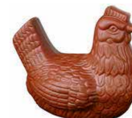
POULE 12 - 15 - 18 cm