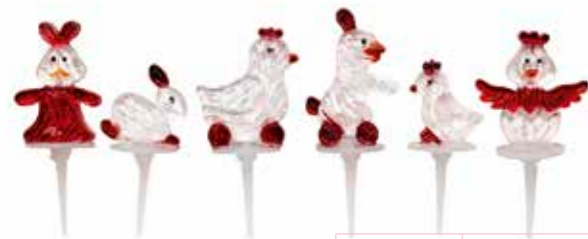
683934 LES AMIS DE PAQUES ROUGE/BLANC 35 mm Boîte de 48