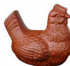
POULE 8 - 10 - 12 15 - 18 cm