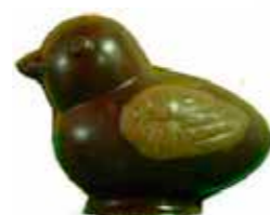
POUSSIN 6,5 cm