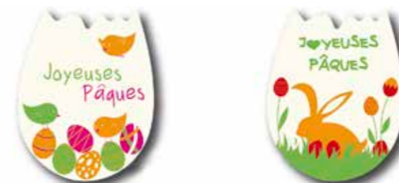
20003 PATE D'AMANDE JP ŒUF 75 x 40 mm Boîte de 60