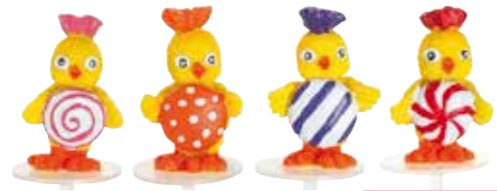
684257 LES POUSSINS BONBONS 35 mm Boîte de 48