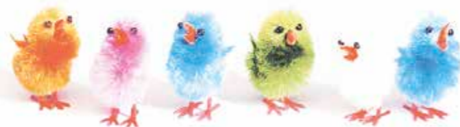
434400 MINIS POUSSINS MUTLICOLORES 30 mm Boîte de 60