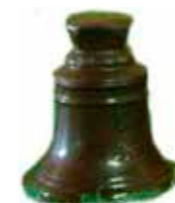
CLOCHE 10 - 19 cm