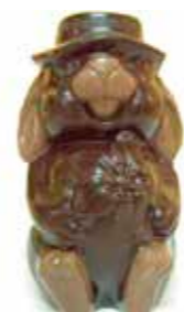
JEANNOT LAPIN 17 cm