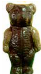
OURS DEBOUT 12,5 cm