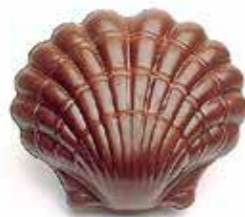
COQUILLE 14 cm