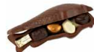
POISSON OUVERT 20 cm