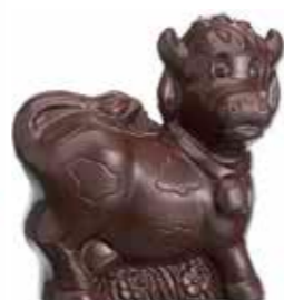
VACHE 12,2 cm