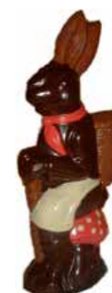
LAPIN 50 cm