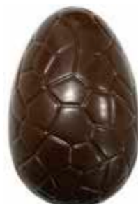
ŒUF 9 - 12 - 13,5 16,5 - 20 cm