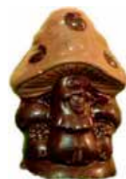
CHAMPIGNON 9,5 cm