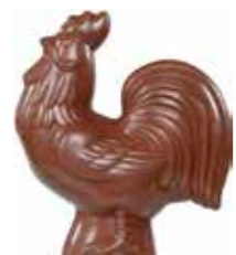
COQ 20 cm