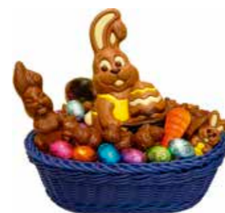
PANIER GARNIER : 2 gros sujets + 4 petits sujets + 4 sachets de fritures noires + 4 sachets d'œufs pliés