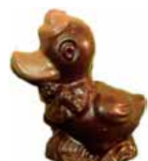
CANARD 8 - 14,2 cm