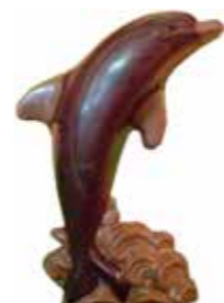
DAUPHIN 27,2 cm