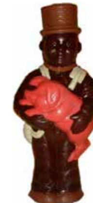
FERMIER 50 cm