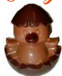
CALIMÉRO 11 cm