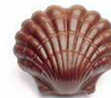
COQUILLE 14 cm