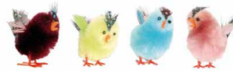
682947 POUSSIN CRÊTE À POIS 40 mm Boîte de 36