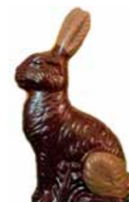
LAPIN ASSIS 17 cm