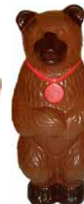
OURS 50 cm